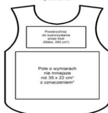
STANDARDOWE ZAGOSPODAROWANIE POWIERZCHNI -tył znacznika