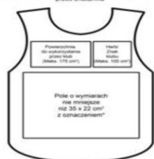
STANDARDOWE ZAGOSPODAROWANIE POWIERZCHNI -przód znacznika