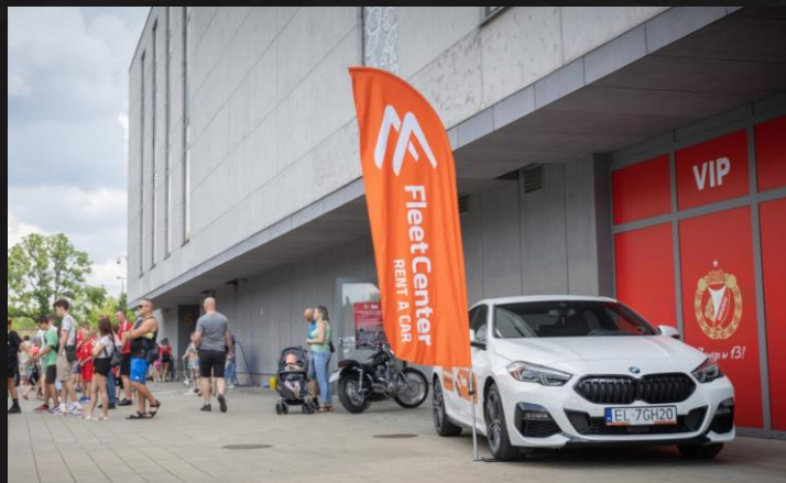
Branding dróg dojścia na stadion