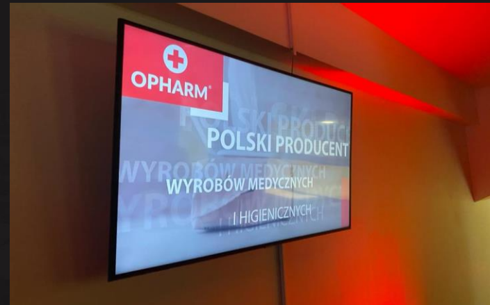
Spot promocyjny w telewizji stadionowej