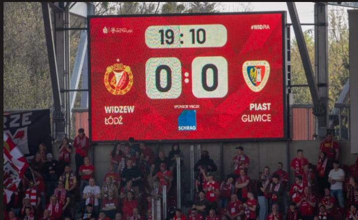
Spot promocyjny na telebimie