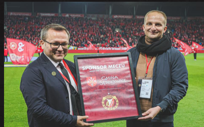
Dedykowana tablica pamiątkowa