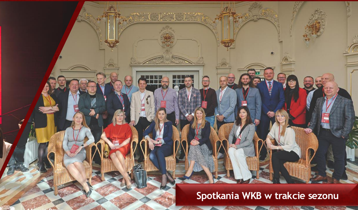
Spotkania WKB w trakcie sezonu