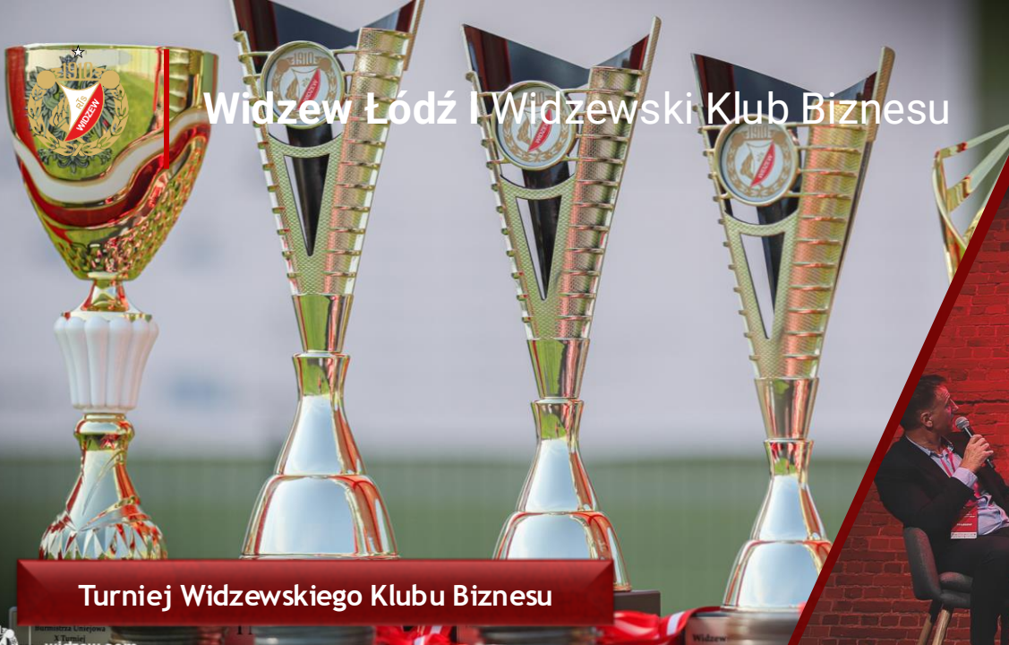
Turniej Widzewskiego Klubu Biznesu