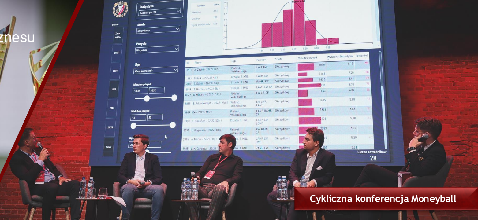
Cykliczna konferencja Moneyball