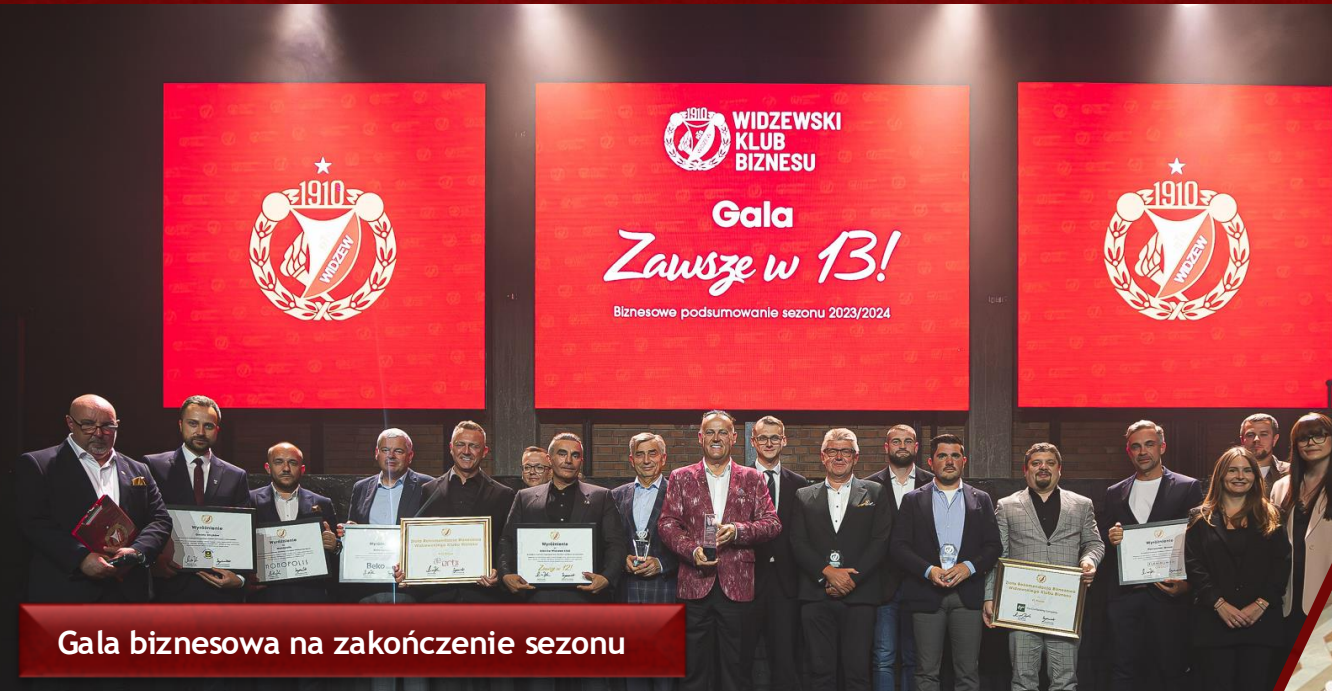
Gala biznesowa na zakończenie sezonu