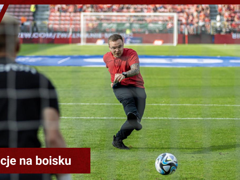
Animacje na boisku