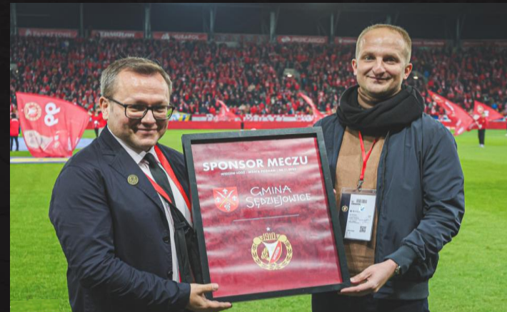
Dedykowana tablica pamiątkowa