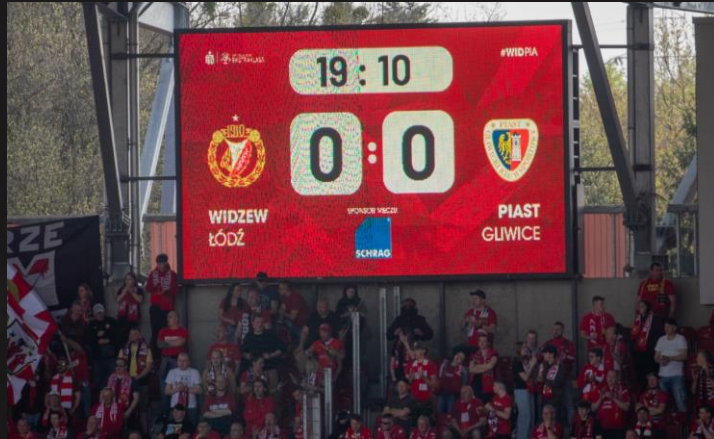
Spot promocyjny na telebimie