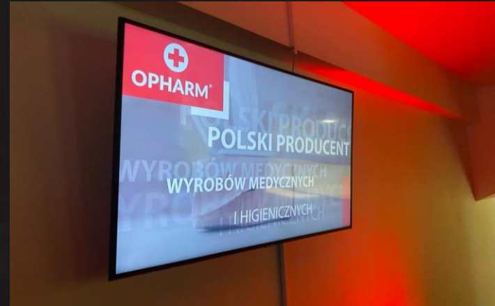
Spot promocyjny w telewizji stadionowej